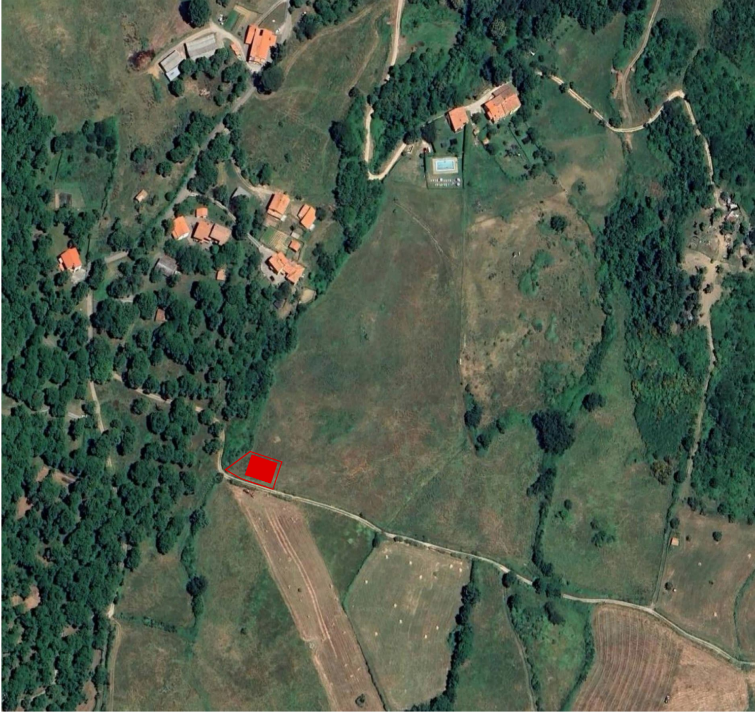
Individuazione collocazione nel mappale 242