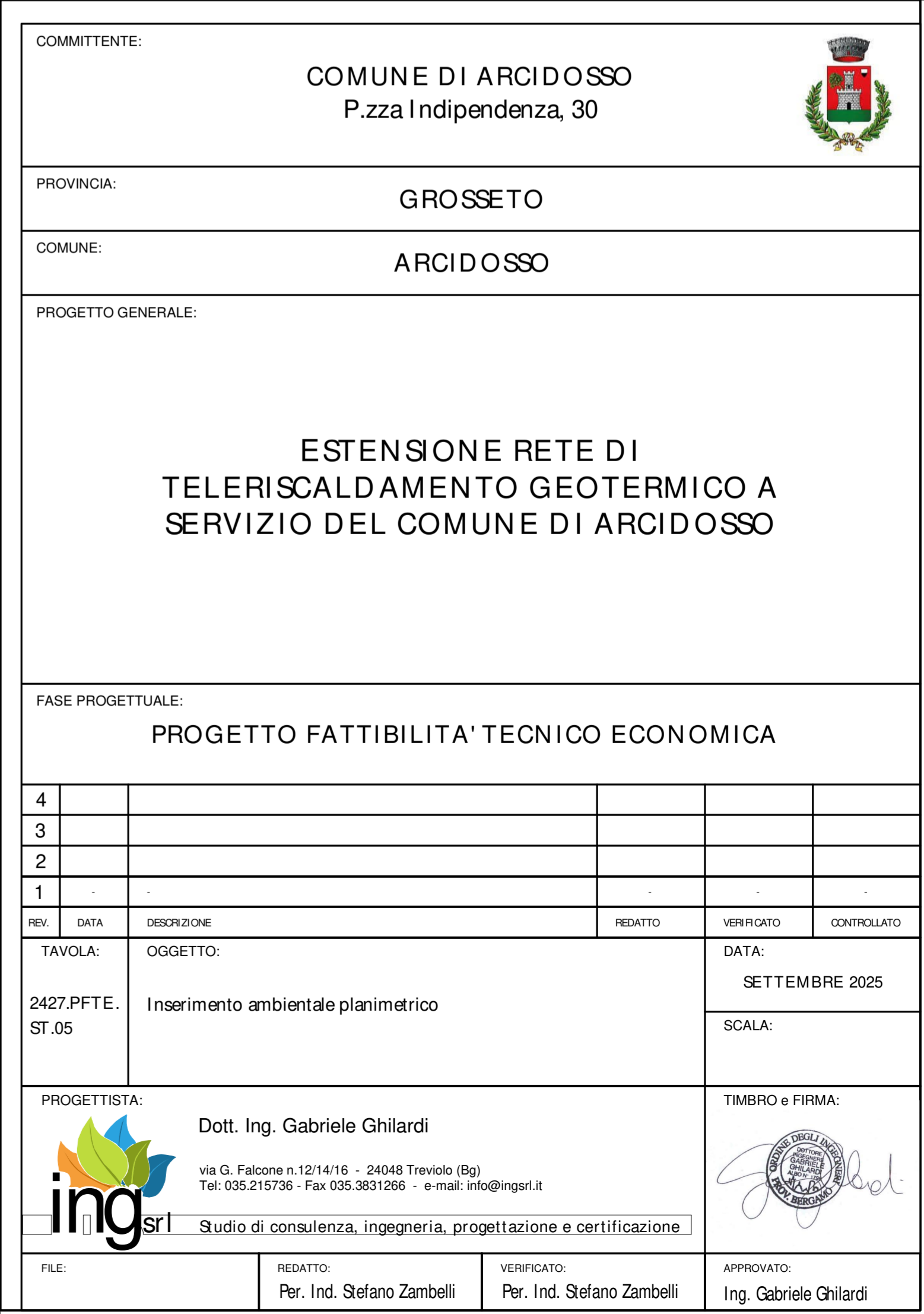
Inserimento sottostazione in mappa